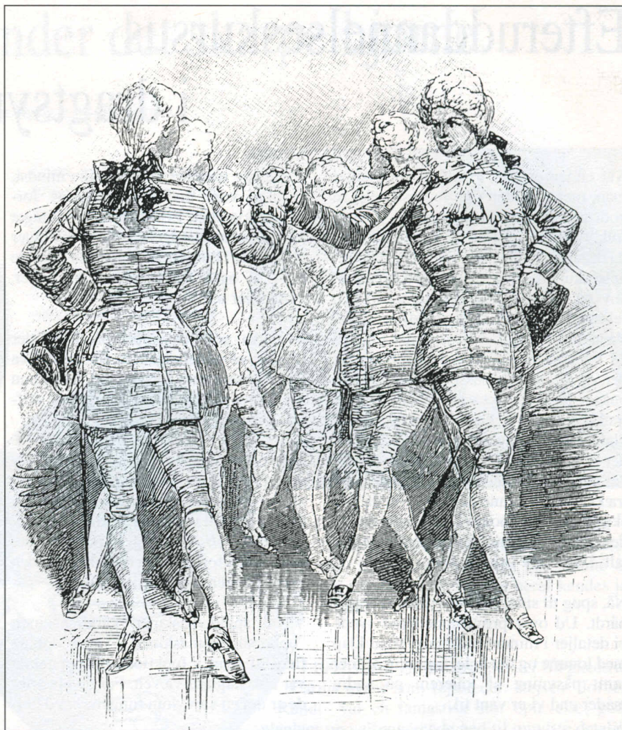
Kadetterne danser Menuet.