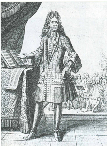
Jean Baptiste Lully.

Ludvig d. XIV var selv en god danser, og havde danset fra han var 5 år gammel. Han gik stærkt ind for styrkelsen af 'de skønne kunster', og oprettede et opera akademi samt et danse- og musikakademi i forbindelse med hoffet. Ofte spillede han selv med i teaterstykkerne og dansede med i balletterne, så det er ikke mærkeligt, at ballet, musik og teater blomstrede i hans regeringstid.