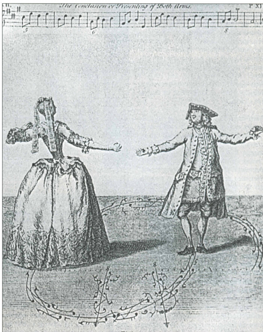
Par der danser menuet (fra Tomlinsons Art of Dancing 1735).

Menuetten er en af de danse, der har overlevet længst, men som så mange andre danse gik den igen af mode. Det skete i slutningen af 1700-tallet og først i 1800-tallet. En medvirkende årsag til menuettens nedtur kunne skyldes, at det mest var i de finere kredse, man dansede den, og at det franske aristokrati i 1789 jo led et nederlag ved den franske